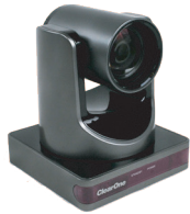
Caméra USB avec dispositif VPIZ UNITE 150