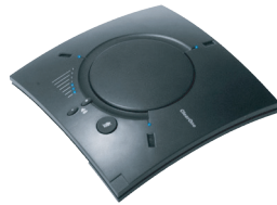
Haut-parleur CHAT 150