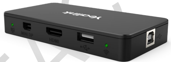
Schéma de câblage du MShare

Le partage se fait en 1080p30 et le WiFi intégré permet le partage sans fil. Les protocoles Miracast et Airplay devraient être supportés très prochainement (date exacte TBA) et étendront le partage à tout type d'appareils supportant ces protocoles (smartphone, tablettes, PC).